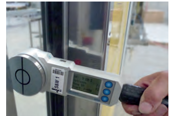
Schließkraftmessung bei kraftbetätigten Türen.